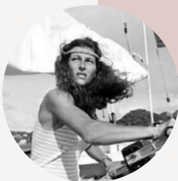
Florence Arthaud 1957-2015 Navigatrice, première femme à remporter la Route du Rhum