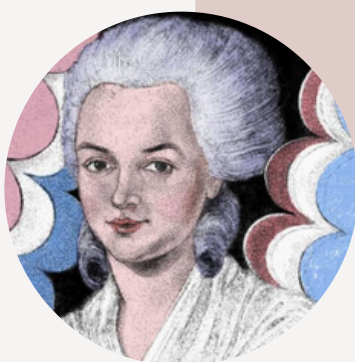
Olympe de Gouges 1748-1793 Dramaturge, femme politique