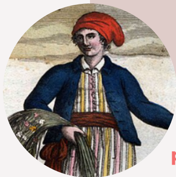
Jeanne Barret 1740-1807 Exploratrice, botaniste et pionnière de la biodiversité