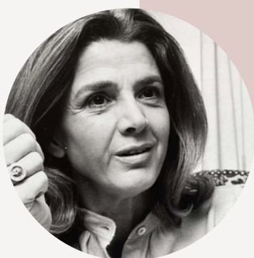
Gisèle Halimi 1927-2020 Avocate, militante féministe