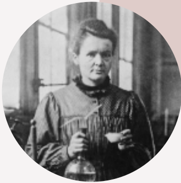
Marie Curie 1867-1934 Physicienne, chimiste