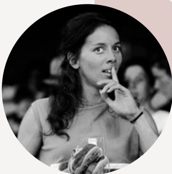
Colette Besson 1946-2005 Athlète olympique JO Mexico 1968