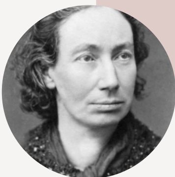
Louise Michel 1830-1905 Institutrice, militante révolutionnaire