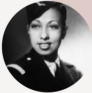
Joséphine Baker 1906-1975 Meneuse de revue, pilote, résistante